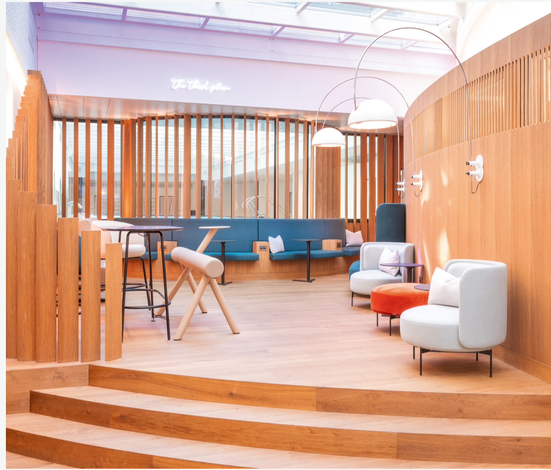
Die geschwungene Eichentreppe führt in «The Third Place» – ein Ort zum Entspannen und Wohlfühlen.

Der Zugang zum neu gestalteten Aufenthaltsbereich wurde durch eine einladende, grosszügige und geschwungene Treppe realisiert. Für den Boden, die Treppe und die weiteren Einbauten kamen hochwertige Materialien zum Einsatz, die exakt aufeinander abgestimmt sind und eine angenehme Atmosphäre schaffen. Die Lamellen als Gestaltungselement ermöglichen die Kaschierung der zuvor dominanten Verglasung zur Poolhalle hin. Dadurch entsteht auf dem neu gestalteten Platz ein geborgenes Raumgefühl. Die Durchsicht bleibt bestehen, während die Fläche gleichzeitig einen klaren Abschluss erhält und als homogene Zone zum Verweilen und Treffen einlädt. Eine besondere Herausforderung stellte die Herstellung der Lamellen dar. Diese sollten – wie der Boden – aus Eichenholz gefertigt sein und beidseitig flügelförmig abgerundet, unregelmässig schräg gefertigt angeordnet, sowie in der Höhe ab 90 cm abgestuft bis zur Decke verlaufend ausgeführt werden. Um diesen vielfältigen Anforderungen