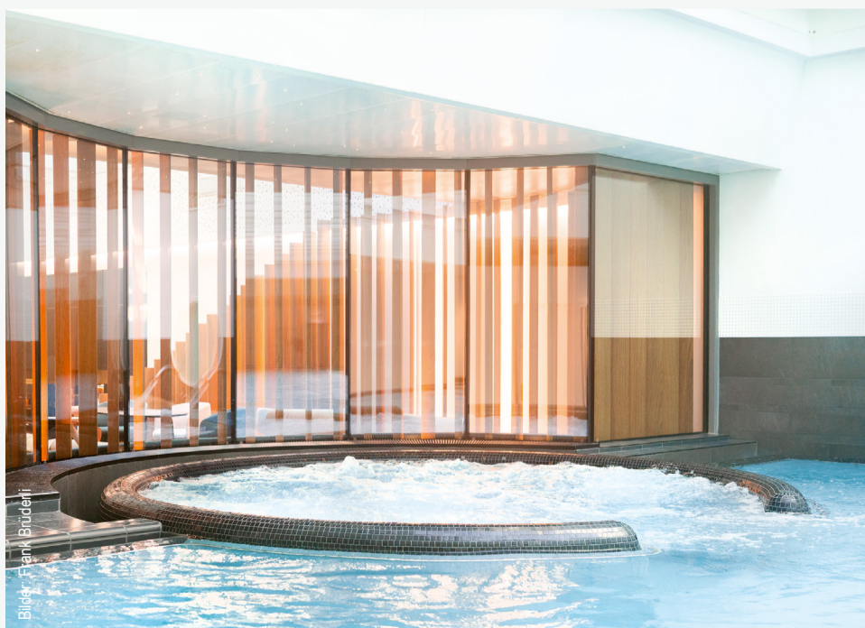
Auch vom Bad her: eine angenehme Atmosphäre dank warmer Lamellenfarbe und weicher Formgebung.

Dank präziser Planung und guter Zusammenarbeit – Fremdarbeiten für Metallbauteile und Polsterungen für die Bänke mussten frühzeitig koordiniert und bestellt werden – konnte das Projekt termingerecht abgeschlossen und die neue Lounge wie vorgesehen eröffnet werden. Wir danken der Bauherrschaft herzlich für den spannenden Auftrag, sowie allen Beteiligten für die erfolgreiche Umsetzung und die angenehme, familiäre Zusammenarbeit. (rs/cb)