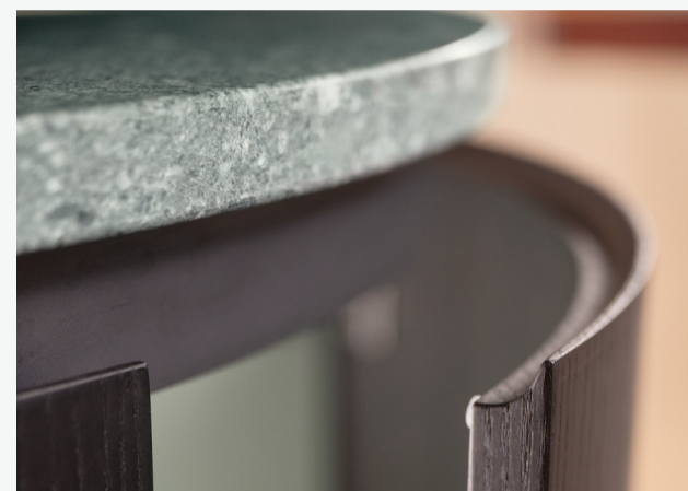
Das gefräste Griffprofil entlang der runden, furnierten Front in perfekter Abstimmung mit der Kontur der Abdeckung.

Die lange Kochinsel mit sanft gerundeten Enden überzeugt durch ihre markante Materialkombination: schwarz gebeizte Esche trifft auf Schwarzstahl. Grosszügige Schubladen und eine vertiefte Arbeitszone rund um das Steinbecken sorgen für hohen Komfort. Ergänzt wird die Insel durch eine helle, imposante Hochschrankzeile in Esche natur mit breitem Kühlschrank. Fall- und einschiebbare Fronten verwandeln den Hochschrank je nach Bedarf von einem ruhigen Monolithen in eine perfekt organisierte Kochwerkstatt. (Red.)