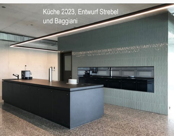
Küche 2023, Entwurf Strebel und Baggiani

Wenn Sie die INFO-Zeitung nicht mehr erhalten möchten, genügt ein Anruf in unser Sekretariat (043 322 77 77) oder eine Nachricht auf info@schneebeli.ch mit dem kurzen Vermerk: «INFO-Zeitung abbestellen». Besten Dank.