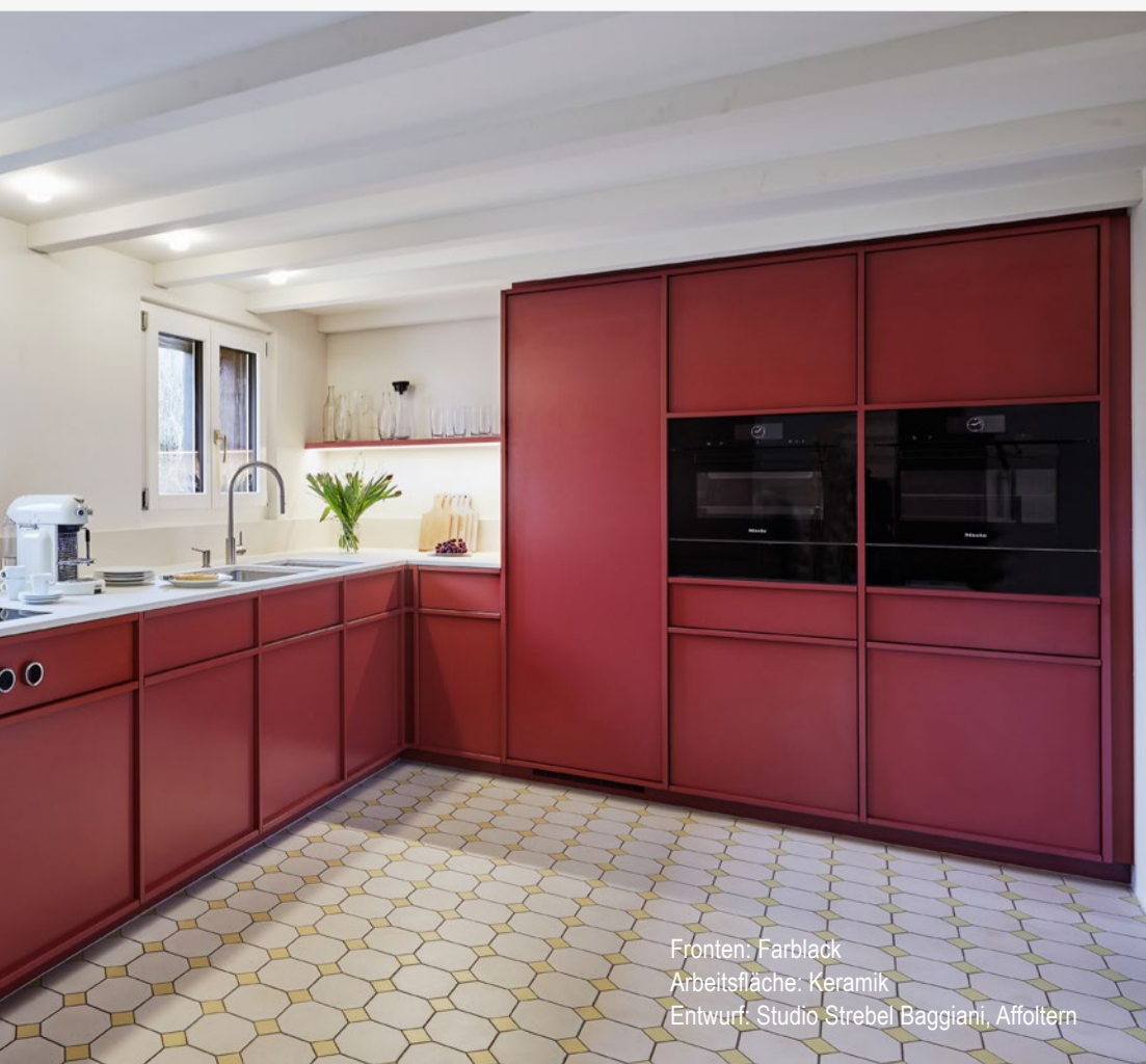
Fronten: Farblack Arbeitsfläche: Keramik Entwurf: Studio Strebelt Baggiani, Affoltern

Aufgrund des definitiven Werkplans werden die dafür benötigten Materialien wie Platten, Massivholz, Laminat und Beläge, Gläser, Abdeckungen und Geräte bestellt. Die Daten des Werkplanes liefern auch die notwendigen Informationen für die maschinelle Bearbeitung des Auftrags. Die Daten für den Zuschnitt des Plattenmaterials werden virtuell optimiert und direkt an die Zuschnitt-Säge übermittelt. Beim Zuschnitt wird jedes Elementteil mit einem Etikett versehen, auf dem sich auch der Strichcode für das automatisch generierte CNC-Programm befindet.