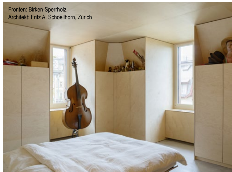
Fronten: Birken-Sperrholz Architekt: Fritz A. Schoellhorn, Zürich