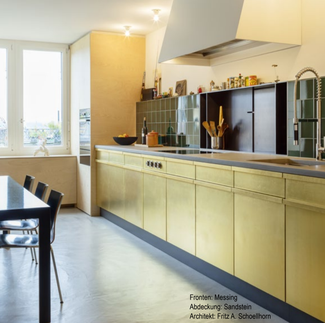
Fronten: Messing Abdeckung: Sandstein Architekt: Fritz A. Schoellhorn