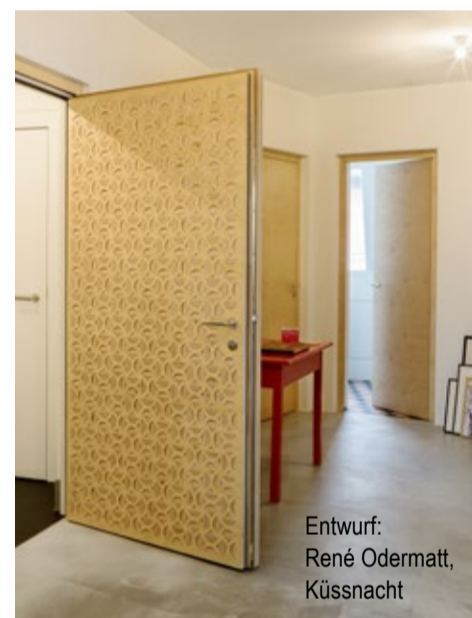
Entwurf: René Odermatt, Küssnacht

Neben der Küche führten wir Schränke, Türen und allgemeine Schreinerarbeiten in diesem Haus aus.