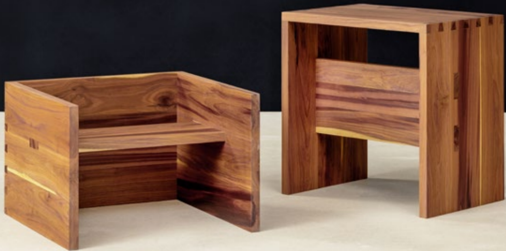
Hocker in Zwetschgenholz, gezinkte Eckverbindungen