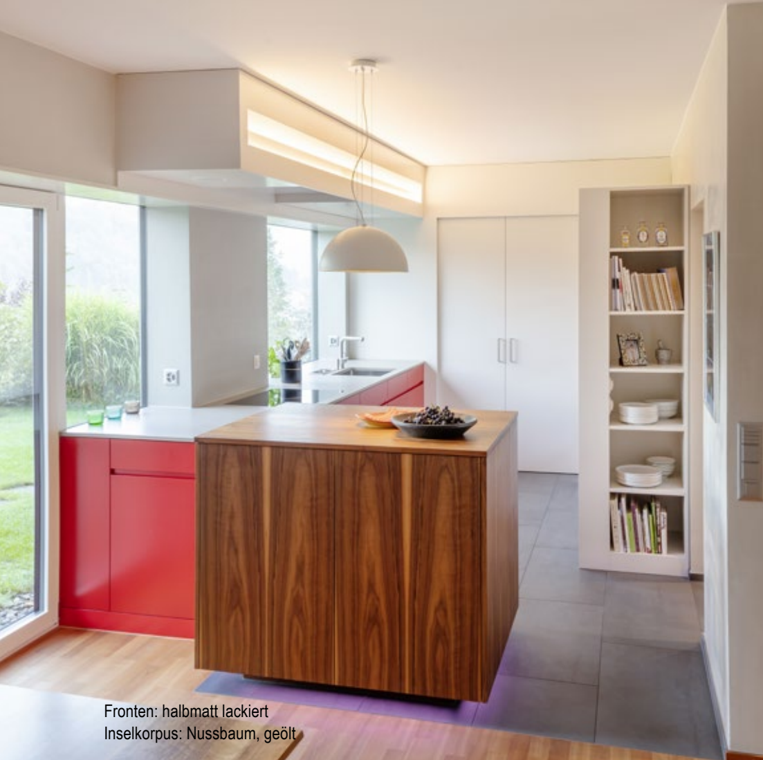
Fronten: halbmatt lackiert Inselkorpus: Nussbaum, geölt