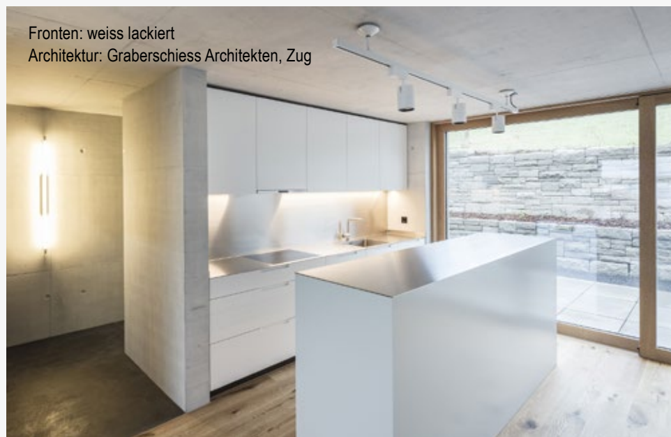
Fronten: weiss lackiert Architektur: Graberschliess Architekten, Zug

Zum Schluss noch ein kurzes Wort zur Pflege von lackierten Oberflächen. Diese benötigen keine Nachbehandlung. Pflegeprodukte, die Scheuermittel enthalten, können Kratzer verursachen. Die Oberflächen nur mit feuchtem Lappen abwischen und gut nachtrocknen. (hs)